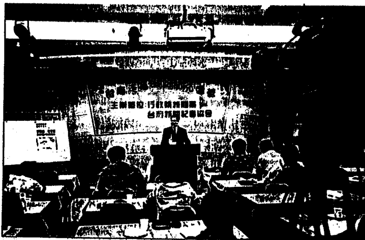
圖台灣記者在台南走馬瀾舉行新聞充電營。

我常問自己專業是什麼？新聞工作者的基本目標、基本角色又是什麼？在多年的新聞工作經驗中，發現專業是從「常識」中出發，而「學習」是認清新聞工作的基本目標，「具體報導」則是營造新聞工作者的基本角色。