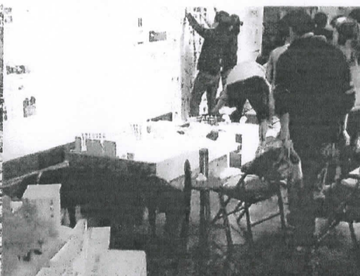
圖二 大五評圖參與照片(一)