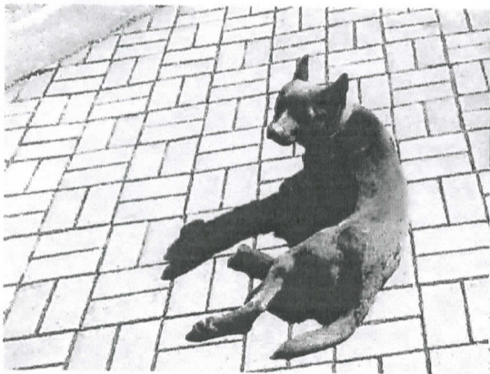
圖四 建築大道伸懶腰晒太陽