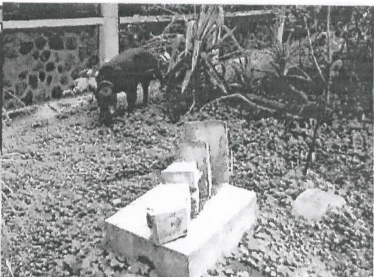
圖六 建築系館前『Ando』的秘密基地

『Ando』基本資料：身高 58 公分；身長 102 公分(不含尾巴)；體重：16 公斤；眼睛色盲但對光影反應敏銳。