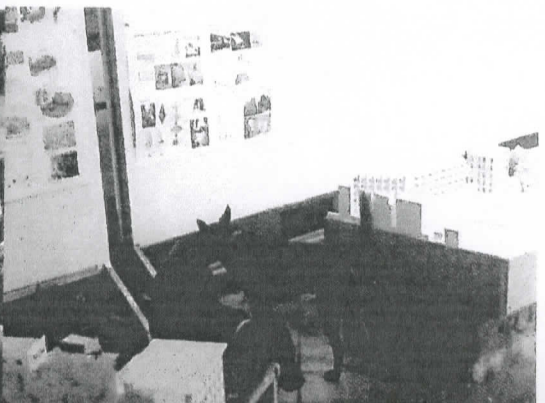
圖三 大五評圖參與照片(二)